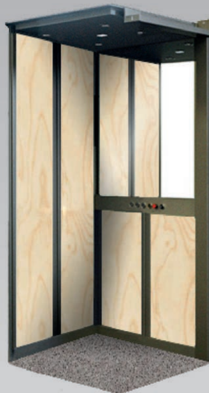
Cabina color abedul, suelo de silestone color "gris expo", bajotecho de leds, espejo de media luna y paneles divididos por omegas.