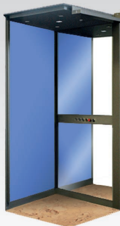
Cabina de color azul, suelo de mármol, bajotecho de leds, espejo de luna completa y paneles enteros.