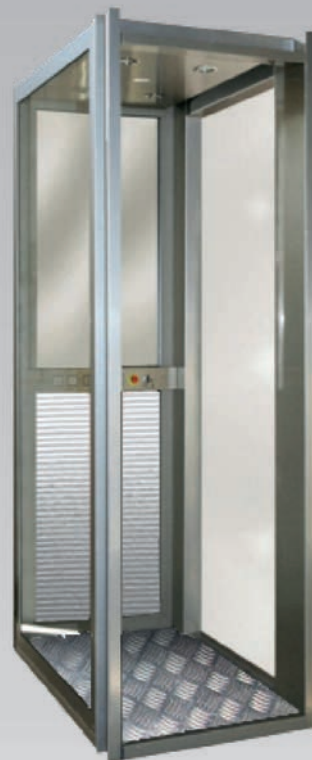
Cabina de color plata, suelo de aluminio damero, espejo de media luna y bajotecho de leds.

Proporciona elegancia y amplitud a cualquier espacio