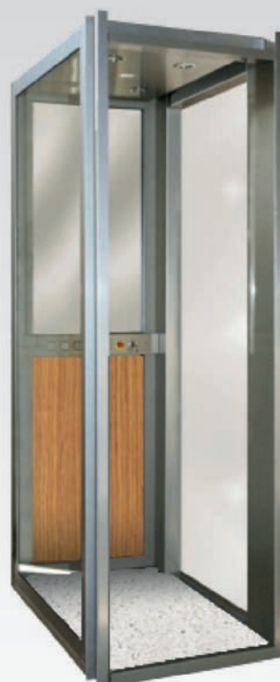
Cabina de color roble claro, suelo de silestone color blanco norte, espejo de media luna y bajotecho de leds.